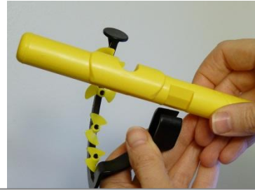
De juiste houding

Zorg voor de juiste houding: het kleine ronde oppervlakje moet horizontaal staan. Leg er ter controle een muntje op.